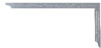
Fabricado em aço inoxidável

O esquadro de carpinteiro é utilizado na produção e no acabamento de uniões de madeira. Os componentes e as peças adicionais podem ser alinhados com precisão. O aparelho também é adequado para a marcação e o dimensionamento.