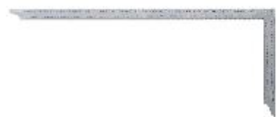
Fabriqu  en acier inoxydable

L'équerre de charpentier est utilisée pour la fabrication et la finition des assemblages de bois. Les éléments de construction et les pièces rapportées peuvent être alignés avec précision. En outre, l'outil convient au traçage et à la cotation.