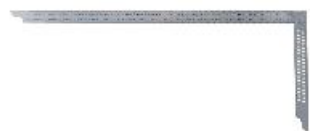
Fabriquée en acier inoxydable

L'équerre de charpentier est utilisée pour la fabrication et la finition des assemblages de bois. Les éléments de construction et les pièces rapportées peuvent être alignés avec précision. En outre, l'outil convient au traçage et à la cotation.