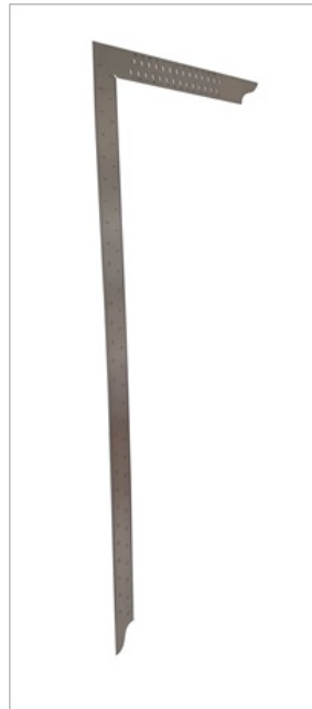
Wykonane ze stali nierdzewnej