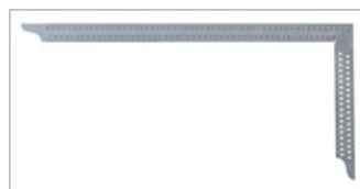
Hecho de acero inoxidable

La escuadra de carpintero se utiliza en la fabricación y el acabado de uniones de madera. Los componentes y las piezas complementarias se pueden alinear con precisión. El dispositivo también es adecuado para marcar y dimensionar.