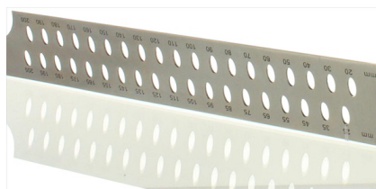
Con agujeros de marcado