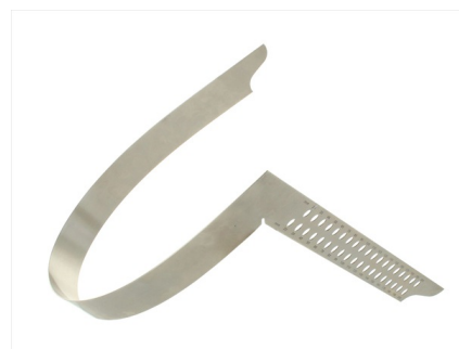
Muy elástico gracias al acero para muelles