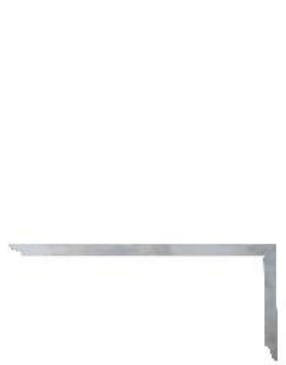
In acciaio inossidabile

La squadra da carpentiere viene utilizzata per la produzione e la finitura di giunti in legno. I componenti e le parti aggiuntive possono essere allineati con precisione. Il dispositivo è adatto anche per la marcatura e la quotatura.