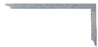
In acciaio inossidabile

La squadra da carpentiere viene utilizzata per la produzione e la finitura di giunti in legno. I componenti e le parti aggiuntive possono essere allineati con precisione. Il dispositivo è adatto anche per la marcatura e la quotatura.