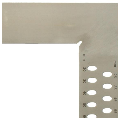
Sans  chelle millim trique