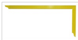
Verniciatura a polvere di colore giallo brillante

La squadra da carpentiere viene utilizzata per la produzione e la finitura di giunti in legno. I componenti e le parti aggiuntive possono essere allineati con precisione. Lo strumento è adatto anche per tracciare e misurare.