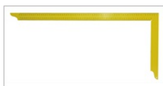
Recubrimiento de polvo amarillo brillante

La escuadra de carpintero se utiliza en la fabricación y el acabado de juntas de madera. Los componentes y las piezas complementarias se pueden alinear con precisión. La herramienta también es adecuada para marcar y medir.