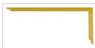
Revêtement en poudre jaune brillant

L'équerre de charpentier est utilisée pour la fabrication et la finition des assemblages de bois. Les éléments de construction et les pièces rapportées peuvent être alignés avec précision. En outre, l'outil convient pour le traçage et la cotation.