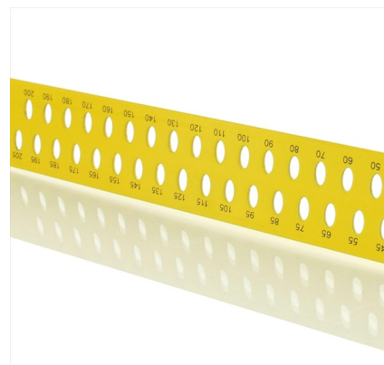
Con agujeros de marcado