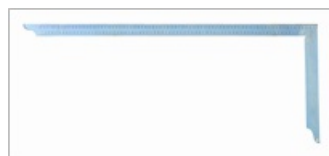
Protection contre la rouille par une galvanisation durable

L'équerre de charpentier est utilisée pour la fabrication et la finition des assemblages de bois. Les éléments de construction et les pièces rapportées peuvent être alignés avec précision. En outre, l'outil convient au traçage et à la cotation.