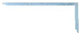
Aus gehärtetem Stahl

Bei der Herstellung und Ausarbeitung von Holzverbindungen kommt der Zimmermannswinkel zum Einsatz. Bauteile und Anbauteile können exakt ausgerichtet werden. Zudem eignet sich das Gerät zum Anreißen und zur Bemaßung.