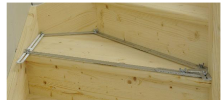
Zum Übertragen von vieleckigen Konturen auf Werkstücke