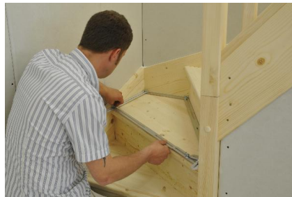
Fast jede benötigte Form kann aufgrund der verschiedenen Aluschiene erstellt werden