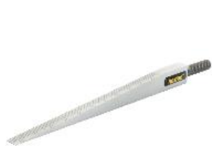
Fácil inspeção de desníveis e lacunas

Por conseguinte, tirar fotografias das medições para fins de documentação também não é um problema.