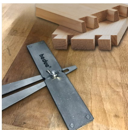
A língua tem uma inclinação de 1:8