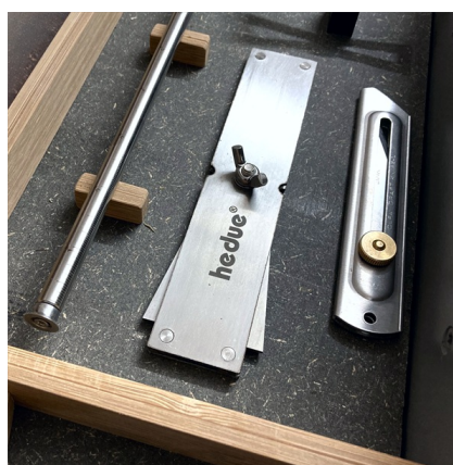
Pode ser rodado 90° para facilitar a arrumação.