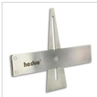
Facilidade de traçar encaixes e encaixes em cauda de andorinha

O Esquadro de cauda de andorinha é a ferramenta ideal para carpinteiros, restauradores e estagiários para uma marcação fácil de encaixes de andorinha e de cauda de andorinha. Graças à sua capacidade de ajuste, o molde de dente também é adequado para dente de funil e pode ser armazenado de forma a poupar espaço.