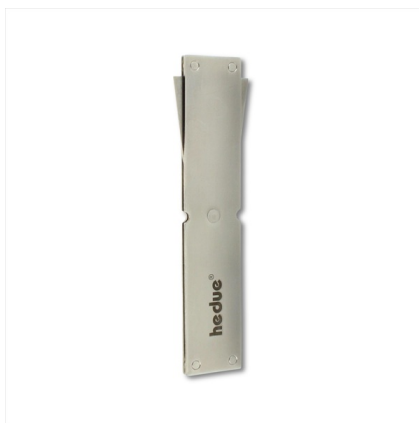
Fabricado em aço inoxidável