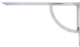
Aus rostfreiem Edelstahl

Zu den schnellsten Anreißmethoden gehört das Anreißern mit dem Anreißgerät Alpha, auch Alphawinkel genannt. Der Alphawinkel kann bei allen Abbundarten verwendet werden und hat sich tausendfach bewährt, sowohl beim Anreißern von Schiftern, Gratsparren und geraden Treppen, als auch beim Anreißern von einfachen und doppelten Versätzen. Stellschmiegen und ähnliche Hilfsmittel werden nicht mehr benötigt.