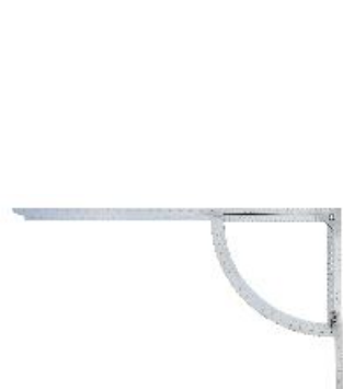
Fabriqu  en acier inoxydable

Parmi les méthodes de traçage les plus rapides figure le traçage avec l'Instrument de traçage Alpha, également appelé Équerre Alpha. L'Équerre Alpha peut être utilisée pour tous les types d'assemblage et a fait ses preuves des milliers de fois, aussi bien pour le traçage d'empannages, de chevrons d'arêtes et d'escaliers droits, que pour le traçage de décalages simples et doubles. Les gabarits de réglage et autres accessoires similaires ne sont plus nécessaires.