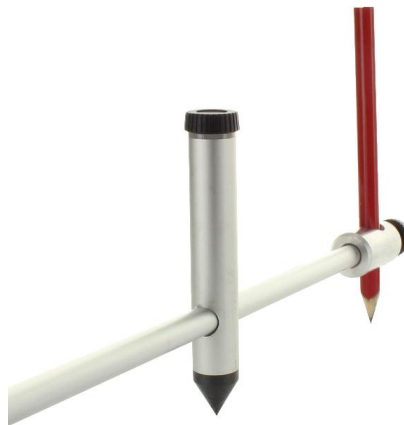
Support pour les  pingles, les traceurs et les couteaux   cran d'arr t.