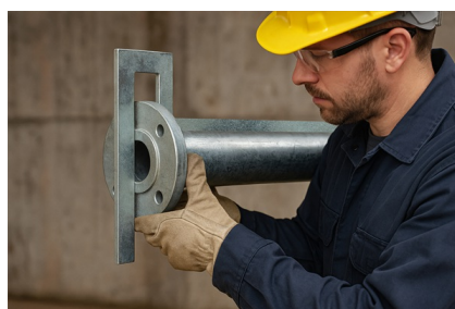
Exaktes Ausrichten von Flanschplatten am Rohrende.