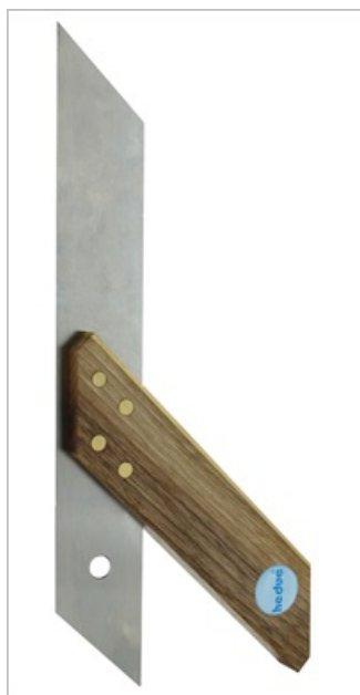
Língua de aço inoxidável

A esquadria é extremamente estável graças à rebitagem quádrupla da lâmina na perna.