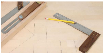
Rimozione e trasferimento degli angoli