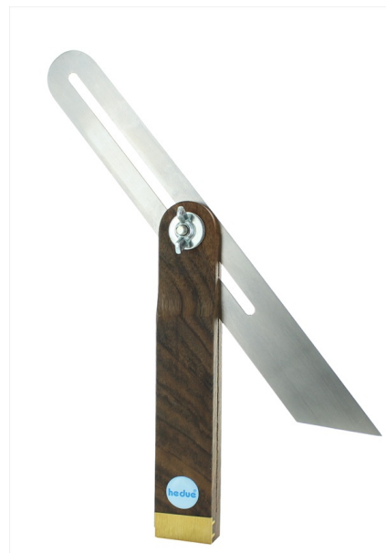
Linguetta in acciaio inossidabile