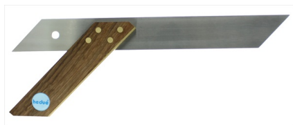
Con raccordo in ottone