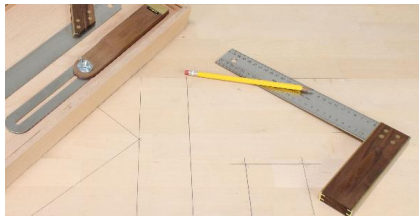
Dépose et transfert d'angles