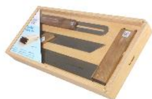
Dans une boîte de rangement en bois

Chaque équerre est calibrée avec une précision d'au moins 0,06°. Vous pouvez obtenir le certificat d'étalonnage en scannant le code QR sur l'équerre.