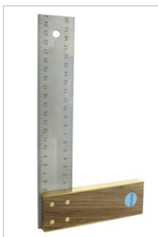
Escala milimétrica dupla e dupla face sobre a chapa de aço

Rebites de latão e um encaixe de latão conferem ao ângulo um aspeto de alta qualidade. Cada ângulo é calibrado com uma precisão de pelo menos 0,06°. O certificado de calibração pode ser obtido através da leitura do código QR no suporte.