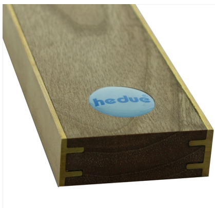
Com encaixe de latão