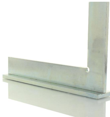
Grundplatte mit Winkelanschlag