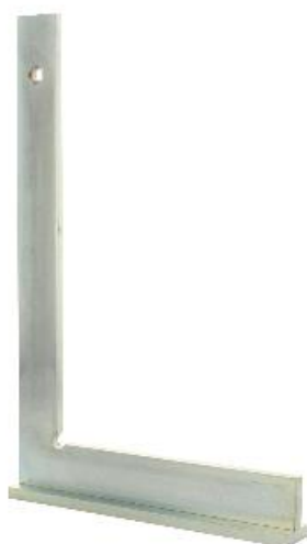
Protection contre la rouille par une galvanisation durable

L'équerre de mécanicien permet de tracer des angles droits, de les vérifier ou encore de les aligner. Elle se distingue par sa grande précision ainsi que par sa fabrication durable et résistante.