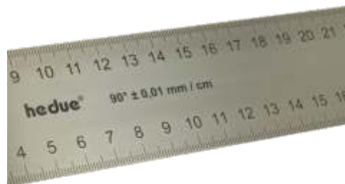
Unsere Winkel erfüllen die hohen Anforderungen der britischen Standard-Norm BS332