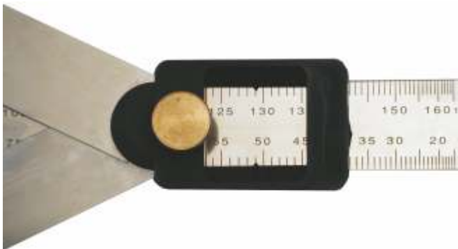
Sauber geätzte und gut ablesbare Gradskala

Lieferumfang: Winkelprofi W455, 2 Verlängerungen, Aufsteck-Wasserwaage und Etui