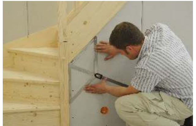
Automatische Winkelhalbierende durch die Mittelschiene für perfekte Gehrungsschritte

Mit der praktische Aufsteck-Wasserwaage bringen Sie den Winkelprofi ins rechte Lot. Ob Winkel messen, Anreißen, Abnehmen oder Anlegen, der flexible Winkelprofi ist immer anpassungsfähig. Der Winkelprofi wird geliefert mit zwei Verlängerungen, Etui, Aufsteck-Wasserwaage und ist versehen mit zwei Skalen von 0 bis 165° und 15° bis 180°.