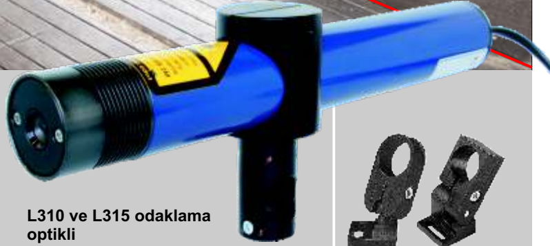
L310 ve L315 odaklama optikli