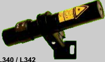
L340 / L342

Çizgi lazeri ile kesit çizgiyi belirtir veya sınai üretimde inşaat unsurlerini pozisyonuna koymak için kullanılır.