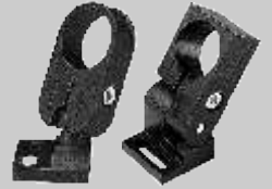
Yuvarlak tutacak (sol) L340 ve L342. Devir- me tutacak (sağ) L300 ve L305.