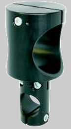
Eklem tutacak L310 ve L315.