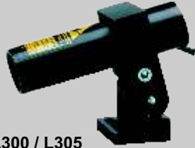
L300 / L305