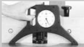
Arka keskin tarafı ölçmek.