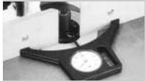
Ön keskin tarafı ölçmek.