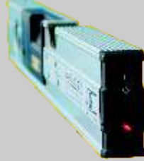
Gerekirse nokta lazerli