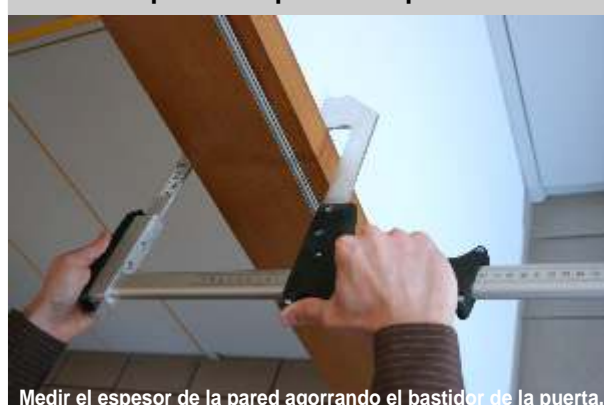
Medir el espesor de la pared agorrande el bastidor de la puerta.

Agarrando el bastidor de la puerta se puede definir exactamente el espesor de la pared. El riel de la forcípula es de plata anodizada y marcada con una escala milimetrica en ambos los lados. La forcípula para paredes es de 60 cm de largura y tiene un campo de medición de 50 cm.