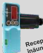
Receptor laser pentru înăuntru și afară