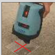
Placă de centrare