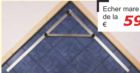
Mecanismul de pliere foarte robust...

Evitați erorile de lucru prin utilizarea acestor echere. Sunt ușor de transportat și astfel folosite pe orice fel de șantier. Echerele sunt precise datorită faptului că sunt îmbinate prin șuruburi. Livrabile cu brațe de lungimi 100 cm, 150 cm și 195 cm. Posibilitate de reglare pentru 45° și 90°. La