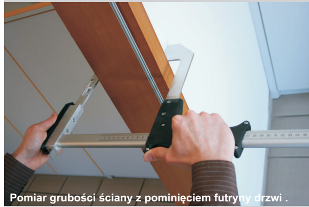
Pomiar grubości ściany z pominięciem futryny drzwi.

Dzięki objęciu futryny drzwi można łatwo zmierzyć grubość ściany, dokładnie i w kilku miejscach. Prowadnica jest anodowana na kolor srebrny i na obu stronach posiada podziałkę milimetrową. Grubościomierz ma 60 cm długości i może mierzyć obiekty o grubości do 50 cm.