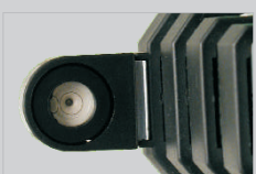
Z poziomnicą i pokrowcem.