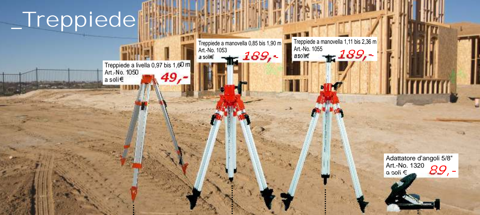
Treppiede a livella 0,97 bis 1,60 m Art.-No. 1050 a soli € 49,-