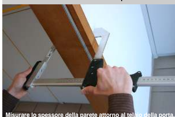
Misurare lo spessore della parete attorno al telaio della porta.

Lo spessore delle pareti puo essere misurato esattamente con il calibro a corsoio per muri, metendolo attorno al telaio della porta. Il listello del calibro é anallizzato e cifrato con una scala millimetrica. Il calibro a corsoio e lungo 60 cm ed ha una portata di 50 cm.