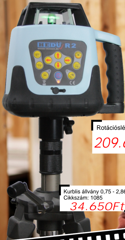
Rotációs lézer HEDÜ R2