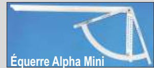
Équerre Alpha Mini

350 x 700 mm ♦ Acier fin inoxydable ♦ Graduation est gravée d'une manière durable Réf. M910 € 59,00