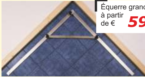
Mécanisme avec un boulon de serrage..

Évitez des erreurs pendant le travail par l'application de ces angles grands. Ils sont facilement transportés et peuvent être utilisés pour chaque chantier. Les angles sont précis par le boulon de serrage. Les angles avec côtés en longueurs de 100 cm, 150 cm et 195 cm sont livrables. Possibilités de régle-