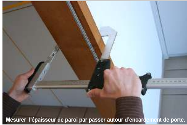
Mesurer l'épaisseur de paroi par passer autour d'encardement de porte.

Avec le pied à coulisse mural l'épaisseur de paroi peut être déterminée exactement par passer autour d'encardement de porte. Le rail de mesure est anodisé en argent et avec une échelle de millimètre mutuelle assorti. Le pied à coulisse mural est 60 cm long et a une zone de mesure de 50