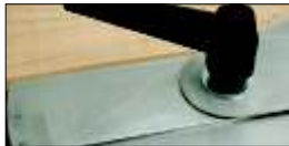
Grand levier de blocage

Cette fausse équerre rapporteur d'angle de 69 cm pesant 3 kg est extrêmement robuste. La plage de mesure de l'échelle va de 0 à 165° avec des graduations de 0,5° : le demi degré est parfaitement lisible, l'écart entre deux graduations étant presque de 1 mm. Le bras de mesure est maintenu par le grand levier de blocage.