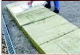
Opération suivante sans avoir à faire un nouveau réglage

Gabarit de coupe pour revêtement isolant Réf. D200 €98,00