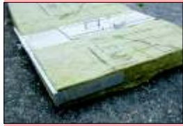
Echelle en millimètres sur la butée longitudinale

Découpe rationnelle et précise des revêtements isolants