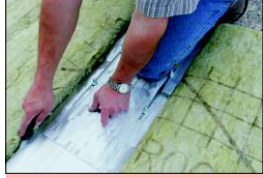
Bord de découpe stable