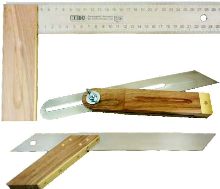
Equerre de menuisier extra large (45 mm). Précision 0,01 mm par cm de lame acier.

Faites un cadeau, à vous-même ou à un ami : équerre droite de 300 mm, fausse équerre et équerre combinée en noyer et acier spécial inoxydable.