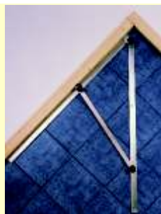
... pour 45° ou 90°

Possibilité de réglage à 45° ou 90°. Equerre facilement repliable pour le transport.