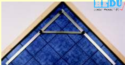
Mécanisme repliable avec raccord fixe ...

Ces équerres grand format vous éviteront des erreurs. Elles sont faciles à transporter et se révéleront utiles sur tous les chantiers. Les raccords fixes assurent une parfaite précision des équerres. Ces équerres sont fournies avec des bras de longueur 100 cm, 150 cm ou 195 cm.