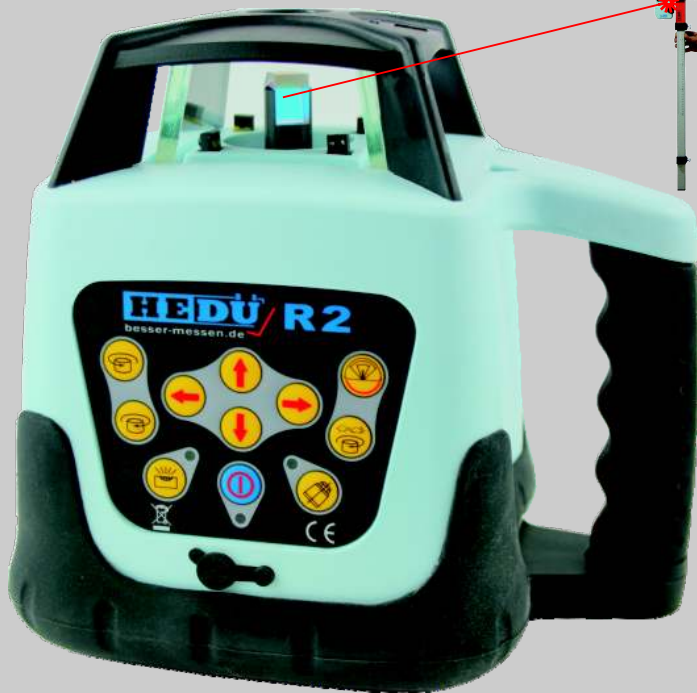
Rotációs lézer R2 vörös lézertéchnológiával Tölt vel, akkuval, távirányítóval, lézer-jelfogóval, kofferrel és min ségi tanúsítvánnyal. R171 179.400Ft,-