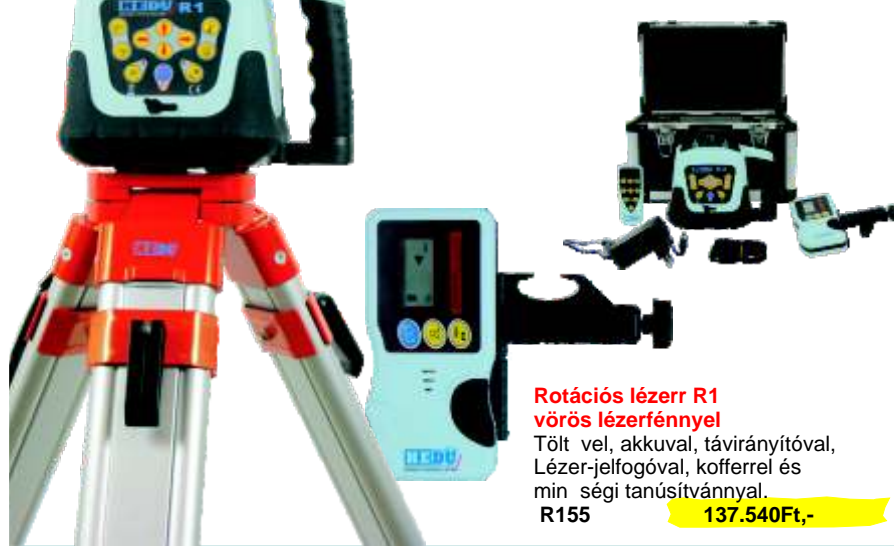
Rotációs lézerr R1 vörös lézertéchnológiával Tölt vel, akkuval, távirányítóval, Lézer-jelfogóval, kofferrel és min ségi tanúsítvánnyal. R155 137.540Ft,-